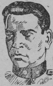
El actual Presidente del Paraguay, Higinio Morínigo, que lucha en estos momentos contra la sublevación.

Las guarniciones esparcidas por las selvas y tierras pantanosas de Chaco Boreal se han unido a las insurgentes, según noticias de Concepción. — Efe.