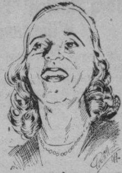
Marie Margaret Truman

Aparte de los Libros taxativamente incluidos en el Índice, en cumplimiento de atención sobre otras novelas nuestros deberes llamamos la y obras extranjeras traducidas al castellano muy libres e inconvenientes, sobre todo para la juventud española, llegando algunas a ser eruditas en sus relatos y a defender doctrinas inmorales. Por ello el juicio crítico del