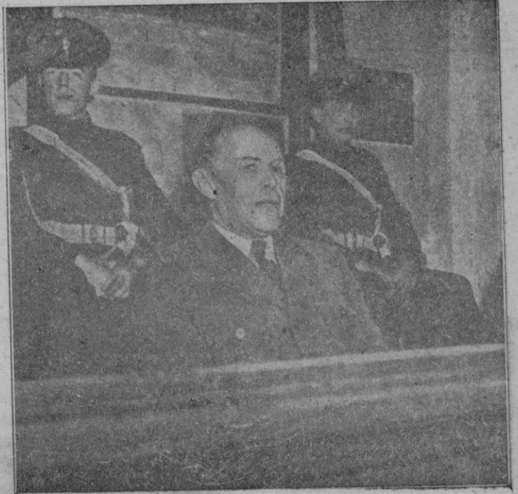
El Mariscal Kesselring ante el Tribunal

El fiscal dijo que el Tribunal está tratando al acusado con toda cortesía y que exige reciprocidad.