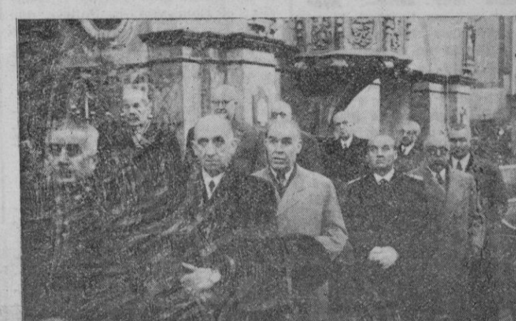
Dos aspectos de las presidencias durante la misa celebrada el sábado en honor del Patrono de los Policías