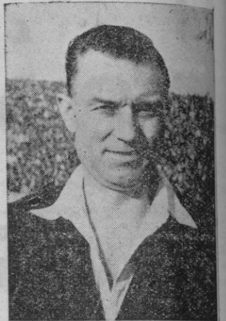
El árbitro inglés Mr. Barryk, que arbitró el partido Irlanda-España que se jugó en Dublin.

Este éxito ha infundido nuevos impulsos a la línea delantera española, que ha realizado en tales momentos