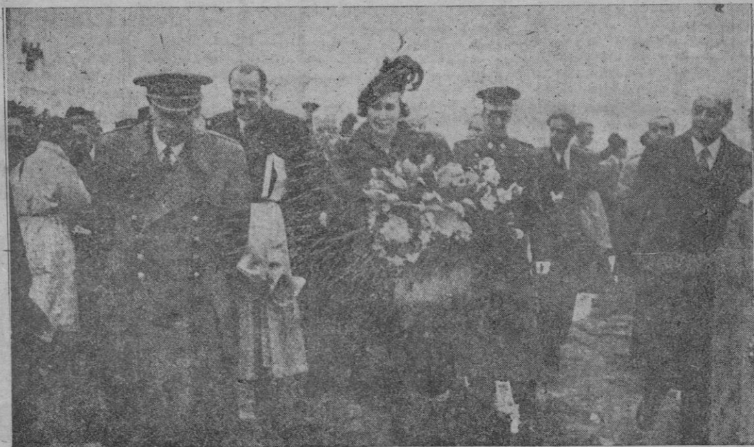
Los Infantes don Jaime y doña Cristina a su llegada a Barcelona, donde les recibieron los generales Solchaga y Coll Fuster

Nueva York — La asociación de veteranos de guerra católicos ha solicitado del Secretario de Estado norteamericano George Marshall, que investigue certeza de las noticias facilitadas por el periódico comunista "Daily Worker", según las cuales el Príncipe de Yugoslavia, Monseñor Stepinac había sido ejecutado.