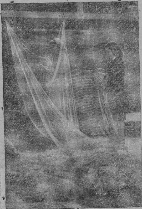
No es una decoración teatral: Estas dos muchachas de Bideport confeccionan redes para la pesca. Desde hace cuatro siglos, Bideport posee una Carta Real acreditándola como concesionaria de todo el cordaje a la Marina británica

Mientras, las cifras de paro forzoso ascienden a trescientos mil obreros, al tener que cerrar sus puertas numerosas instalaciones industriales por falta de hulla o antracita. La persistencia del temporal, con la consiguiente dislocación de los transportes, da pocas esperanzas al sur de Inglaterra de que pueda reponerse pronto de las