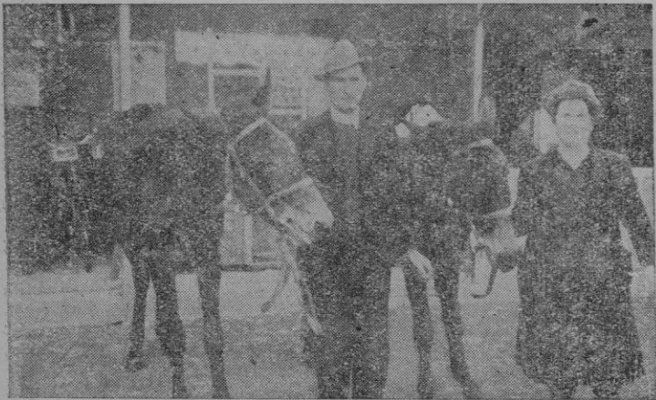
Los agraciados con el primer premio recogen el magnífico lote que les correspondió

Nota. — Se ruega a los agraciados se sirvan recoger los demás premios en la Institución benéfica de la Cruz Roja., calle 31 Diciembre, Palma.