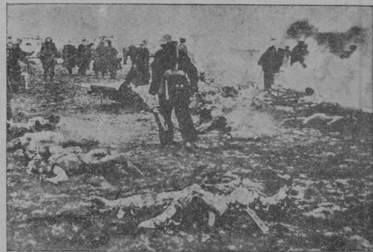
Mañana aspecto del lugar donde ocurrió el accidente aéreo que costó la vida al Príncipe Gustavo Adolfo, a Grace Moore y otras 20 personas. En la fotografía se ven algunos cadáveres esparcidos por el suelo y los encargados del servicio de incendios reduciendo las llamas de los restos del aparato