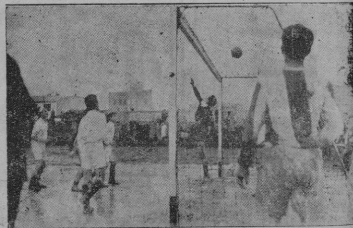
La portería del Sueca en una de las ocho veces en que fué batida