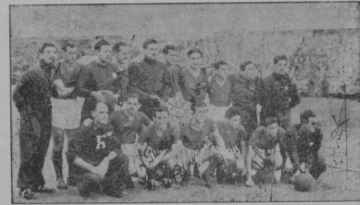
El San Lorenzo de Almagro, que realizando una exhibición de buen futbol, derrotó por 10 a 4 al equipo de Portugal

10 A 4 SEÑALABA AL FINAL EL MARCADOR. -- ZUBIETA FUE LA FIGURA DESTACADA DEL ENCUENTRO