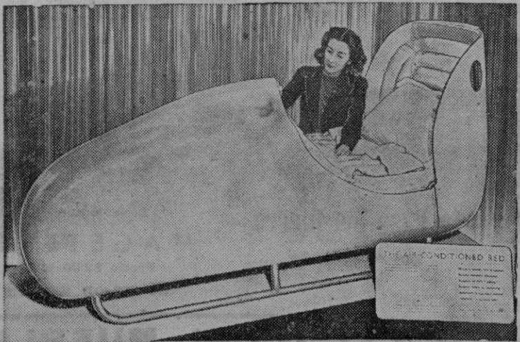
Original modelo de cama portátil, con acondicionamiento de aire y calefacción, que figura en la exposición celebrada en el Museo Alberto y Victoria de Londres