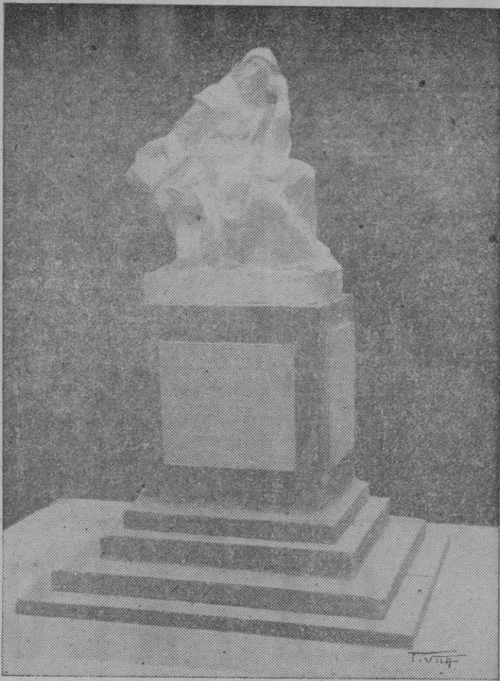
Proyecto de monumento a Ramón Llull, en piedra mármol, que se levantará en uno de nuestros pueblos, obra del escultor T. Vila

Todos los asistentes al acto fueron obsequiados con una copa de vino español.