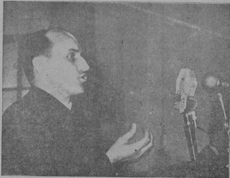
Monseñor Stepinac, cuya injusta condena por un tribunal de Belgrado ha levantado la protesta unánime del mundo civilizado

Jamás ha habido un Estado que se preocupase más por los campesinos y por el agro español, ni un Estado que heredase más dificultades, más devastaciones que las que el actual Estado español heredó. Jamás ha habido ningún Ré-