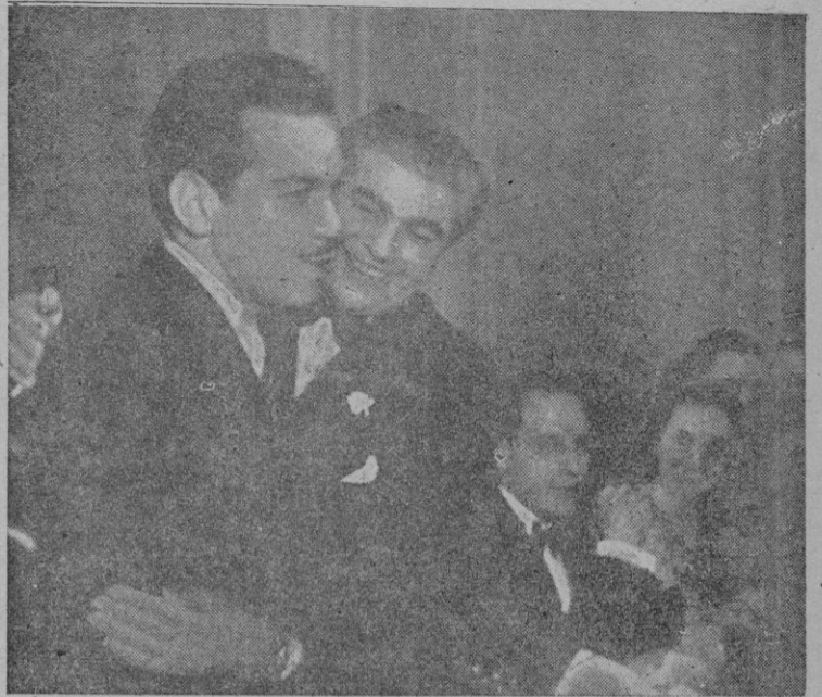
"Cantinflas" abraza al director cinematográfico D. Cesáreo González en el banquete homenaje celebrado el pasado domingo en Madrid