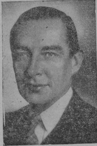
Sir Ralph Stevenson, que ocupó un importante cargo en el Consulado General de Gran Bretaña en Barcelona, nombrado recientemente embajador inglés en China.

A pesar de todo ello, el Gobierno republicano en el exilio se empeña en añadir una falsedad más a todas las anteriores y sigue buscando en la ingerencia extranjera la satisfacción de sus mezquinas ambiciones.