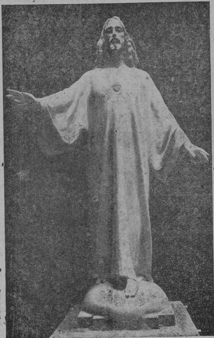
Imagen del Sagrado Corazón que coronaba el Monumento del Cerro de los Angeles