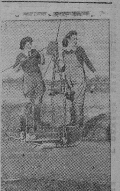
Dos típicas muchachas agregadas a los trabajos agrícolas del Consejo Británico para la conservación de la tierra

Los premios establecidos son diez: el primero de 1.000 pesetas. Aparte de estos premios todos los participantes percibirán el jornal de 10 pesetas diarias durante los días que han permanecido alejados de su trabajo, sufragándose los viajes y la manutención por la sección central de rurales. — Cifra.