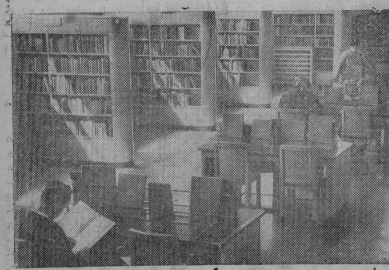
Vista interior de la biblioteca regional de Kenton, Middx

Chungking. — Según una información de prensa, el Emperador desaparecido del Mandchukuo y que antes ocupó el trono de China, será en breve entregado por las autoridades rusas que le tienen en una prisión siberiana al Gobierno central chino, a fin de que se le instruya procesalmente. — Efe.