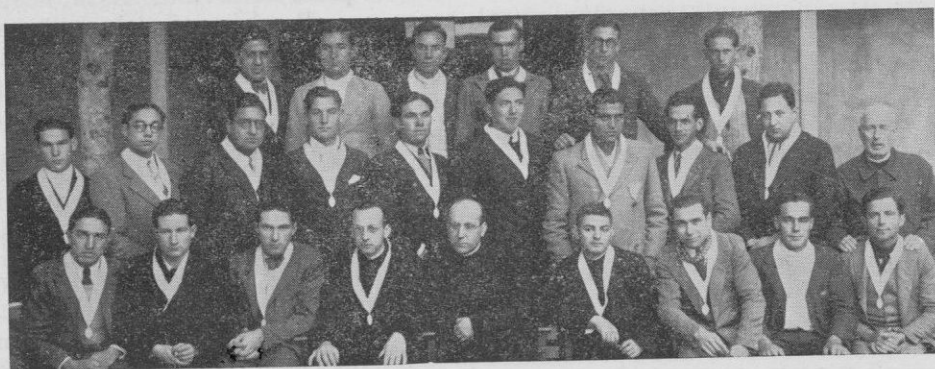
Tanda d'exercicis de l'any 1931