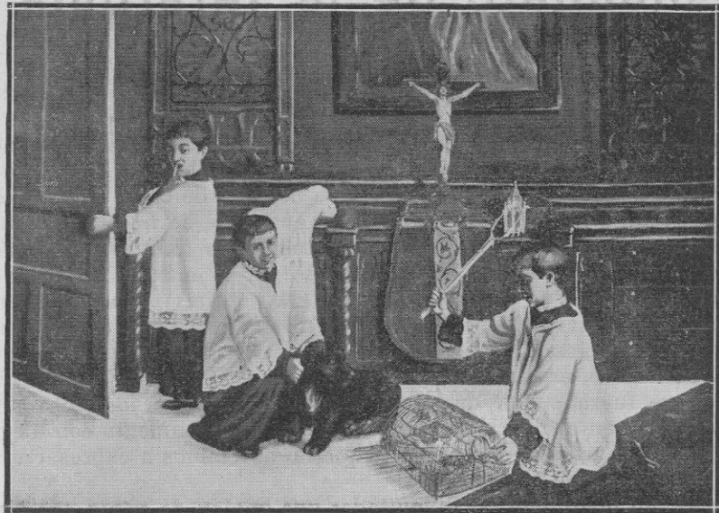
«Ratas de Sacristía», cuadro pintado por Jesús G. de Echávarri