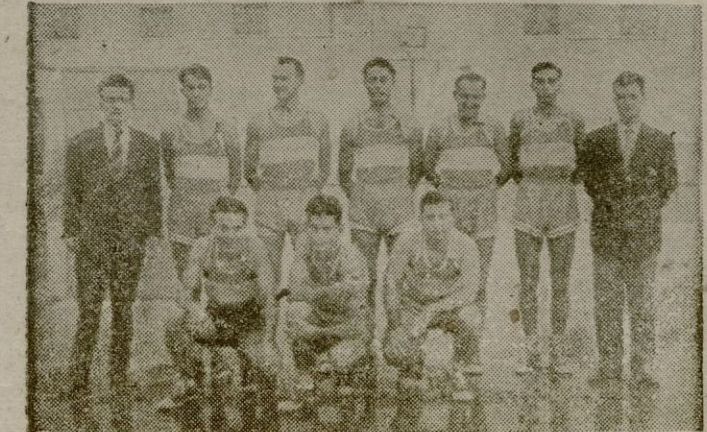
Equipo del Patronato, que el domingo disputará el primer puesto al del Hispania

En los dos restantes encuentros, el Nazaret, que recibe al Hispania ha de vencerle fácilmente, al igual que el Patronato, que triunfará sobre su visitante Loyola.