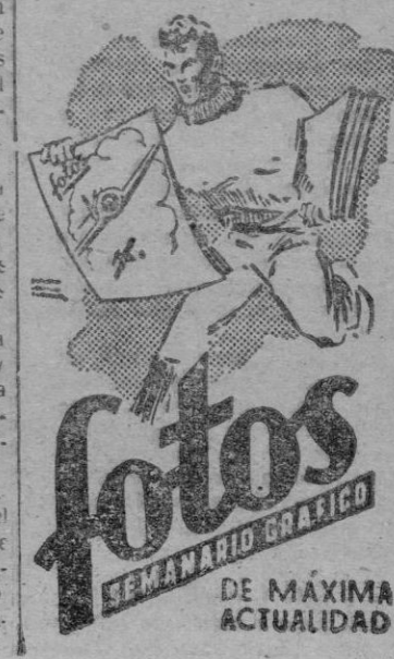
fotos SEMANARIO GRAFICO DE MÁXIMA ACTUALIDAD

Circuló por Madrid en estos días el rumor de que Celia Gámez, actualmente en el Teatro Maravillas, se retiraba de la escena. Nosotros nos hemos informado cerca de la popular «vedette», para que nos dijese de la verdad de estos rumores. Celia Gámez, nos ha manifestado que por lo pronto no estrenará esta temporada la opereta que había anunciado, y cuyo título es «S. E. la Embajadora», porque ya a estas alturas de la temporada, y dado el sumptuoso montaje que ella pretende realizar, no le convenía a los efectos económicos. Quiere decir que una obra necesita de arranque, al menos cinco meses de continuidad en Madrid, para resarcirse de los gastos iniciales. Como quiera, que dadas las dificultades del montaje, este estreno no podrá verificarse hasta primero de marzo, de ahí el que lo aplazase. En este sentido, Celia dará por terminada su campaña en el Maravillas en los primeros días de febrero, y se presentará de nuevo en Madrid durante el mes de octubre. También nos dijo que este estreno de la próxima temporada, será el de su retirada definitiva.