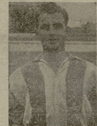
¿Será Miquel quién cubrirá el puesto de extremo izquierda?

Por lo que respecta a la visita del Menorca se la espera con interés, ya que es uno de los equipos que más lucha han dado a lo (Continúa en la pág. siguiente)