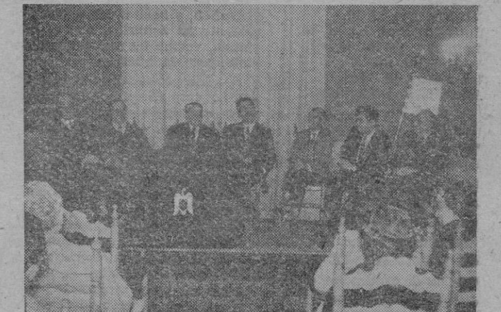
La presidencia del coloquio organizado por la revista «Cisneros» en colaboración con el «Círculo Medina».

ron los nuevos Premios de la Revista «Lealad», muy importantes este año —las bases del concurso serán dadas a conocer por la publicación— y el señor Mar-