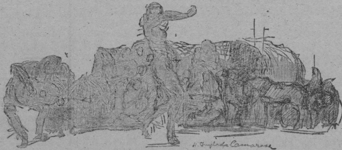
Uno de los dibujos de A. que ilustran el libro

Pero ¿y la alegría? ¿Es que la alegría no admite trascendencia? ¿Es que lo trascendente se ha de sentir siempre a lo angustiados, a lo trágico? Por mi parte, la alegría sólo en momentos de gran alegría creí, he creído ver el rostro de Dios, si es que este puede decirme en el perfecto ensayo de una conversación, por ejemplo, o en el goce de algo hondamente amado (porque claro está que el amor no es destrucción ni muerte, sino vida y creación y luz). Temo que tenga razón Hufinska al decir que la historia nos conlleva a las épocas que de su alegría. Sin embargo, he hablado obras ale-