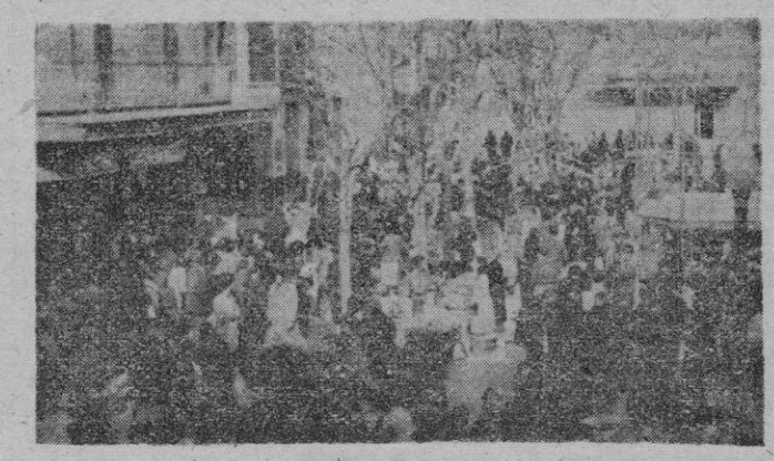
La plaza mayor de Inca, en un día de mercado