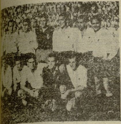
EL EQUIPO DEL «CONSTANCIA»

Los inquenses preparados para este difícil partido