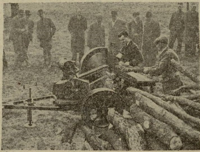
Está obteniendo un gran éxito la utilización de estas aserradoras portátiles arrastradas por un "Jeep" o una pareja de animales, sin ser necesario el tractor. La aserradora se instala en el lugar del bosque. Accionada por un pequeño motor de gasolina puede segar dos millares de troncos en la jornada.