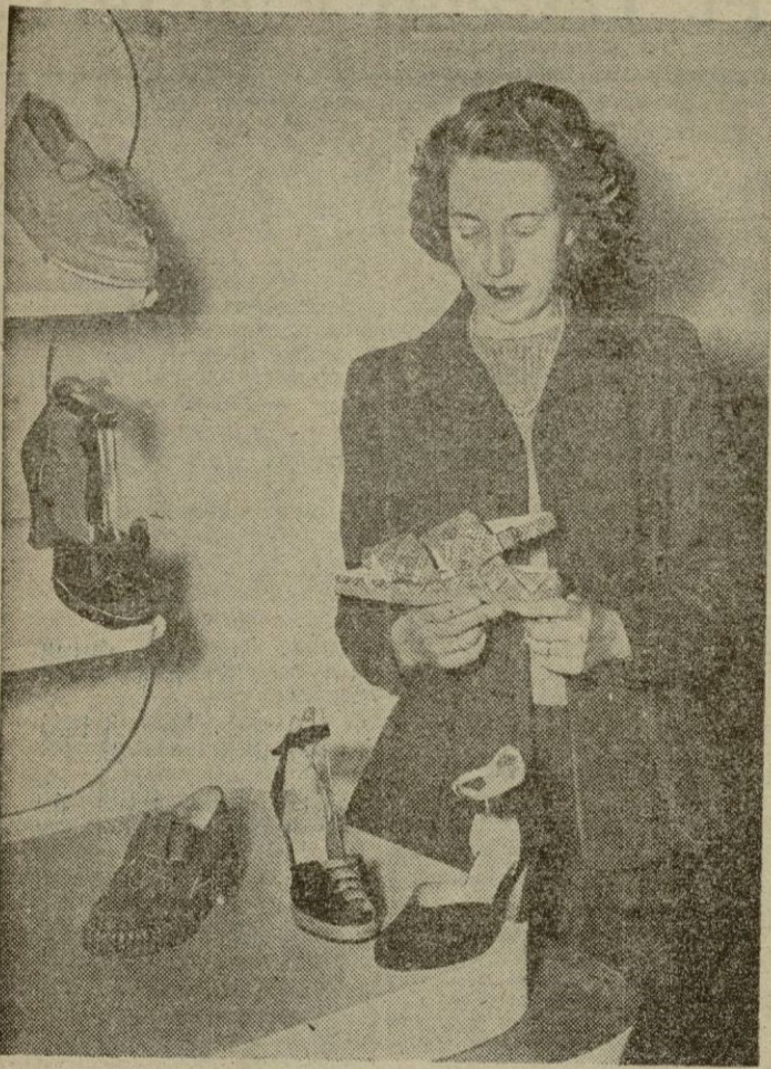
En cierta ocasión les hablamos a nuestros lectores de la invención de unos zapatos de plástico de una sola pieza, irrompibles e indeformables a muy largo plazo. Pues bien; aquí les mostramos algunas de estas piezas que se exhiben en una Exposición de arte zapateril en Londres. Solo queda por saber el precio de estos zapatos y si los modelos exhibidos les gustan a nuestras lectoras.