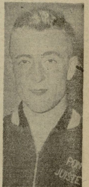
DE BRUYNE, vencedor de la etapa solo quedan en carrera 82 corredores.

Koblet, Huber y Metzger (Suiza) y Hout (Sudoeste), por lo que