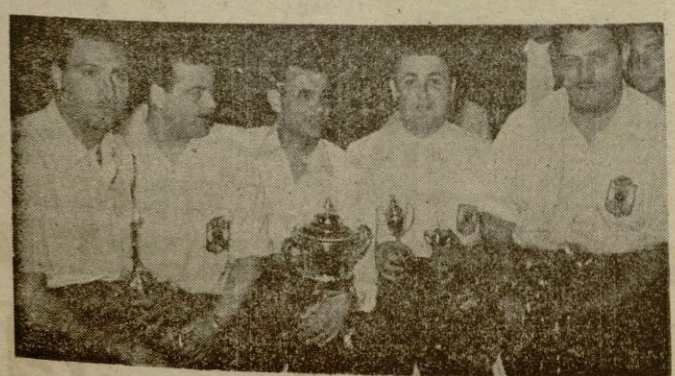
El conjunto catalán del "Bolo Club Palma", que resultó vencedor sobre el "Bolo Club Palma", en el encuentro disputado en las boleras de "Miami"