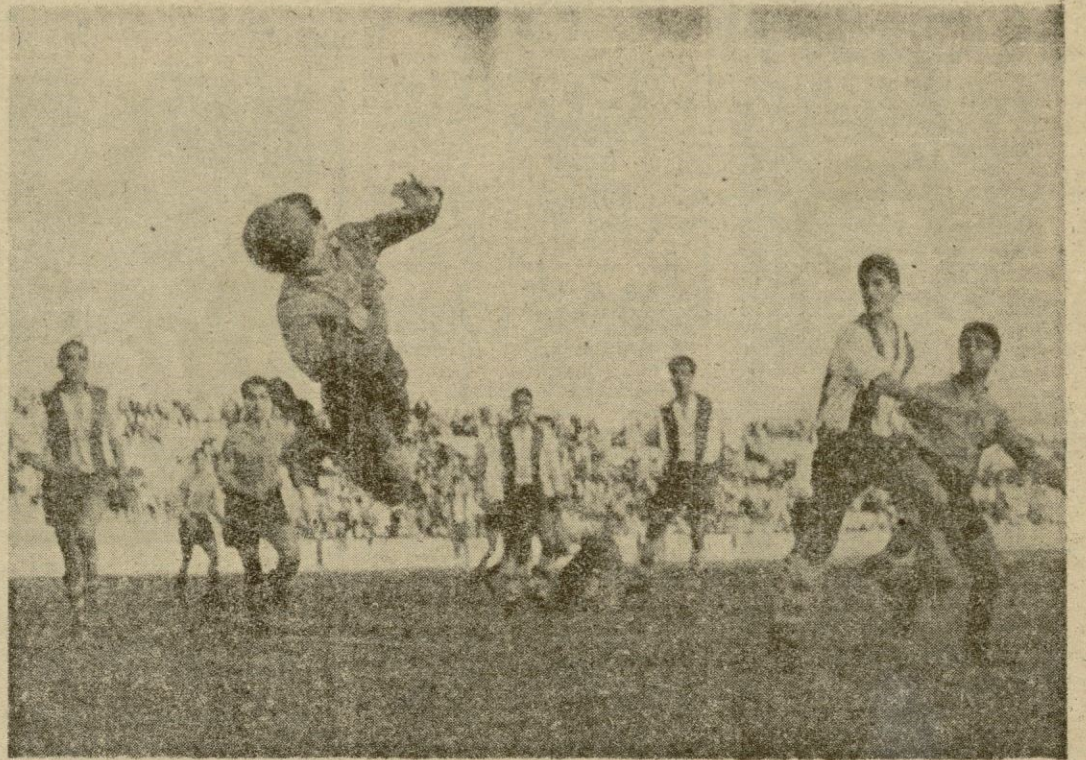
Aquel remate de Ramó pudo haber decidido el partido, pero el balón salió fuera junto al poste si bien el portero del Alcoyano había cubierto su puerta.