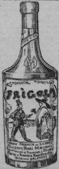
LICOR DE ALTA CALIDAD