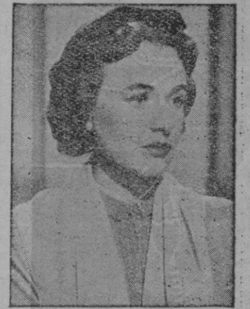
La principal figura femenina.