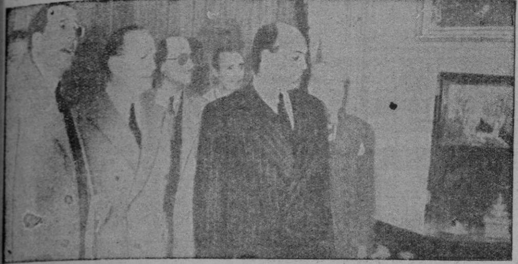
Ministro Secretario General del Movimiento, con el Delegado Nacional de Sindicatos y el Jefe de la Unión Sindical "Artesanía", visita la Exposición Internacional que actualmente se prepara en el palacio del Retiro