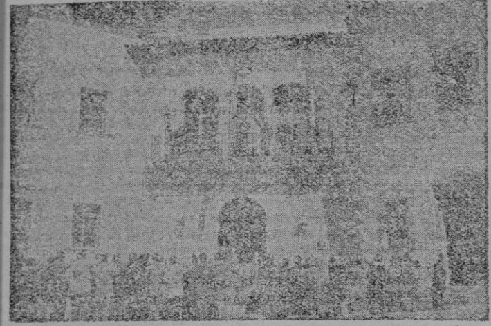
Dos momentos de los actos.