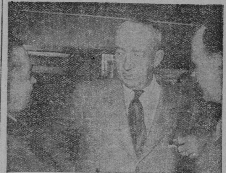
MUTUAMENTE, dice el general norteamericano Eichelberg, del Servicio de Reserva y héroe del Pacífico, a los periodistas catalanes a su llegada a Barcelona a bordo del trasatlántico "Constitución", donde ha sido tomada la fotografía.