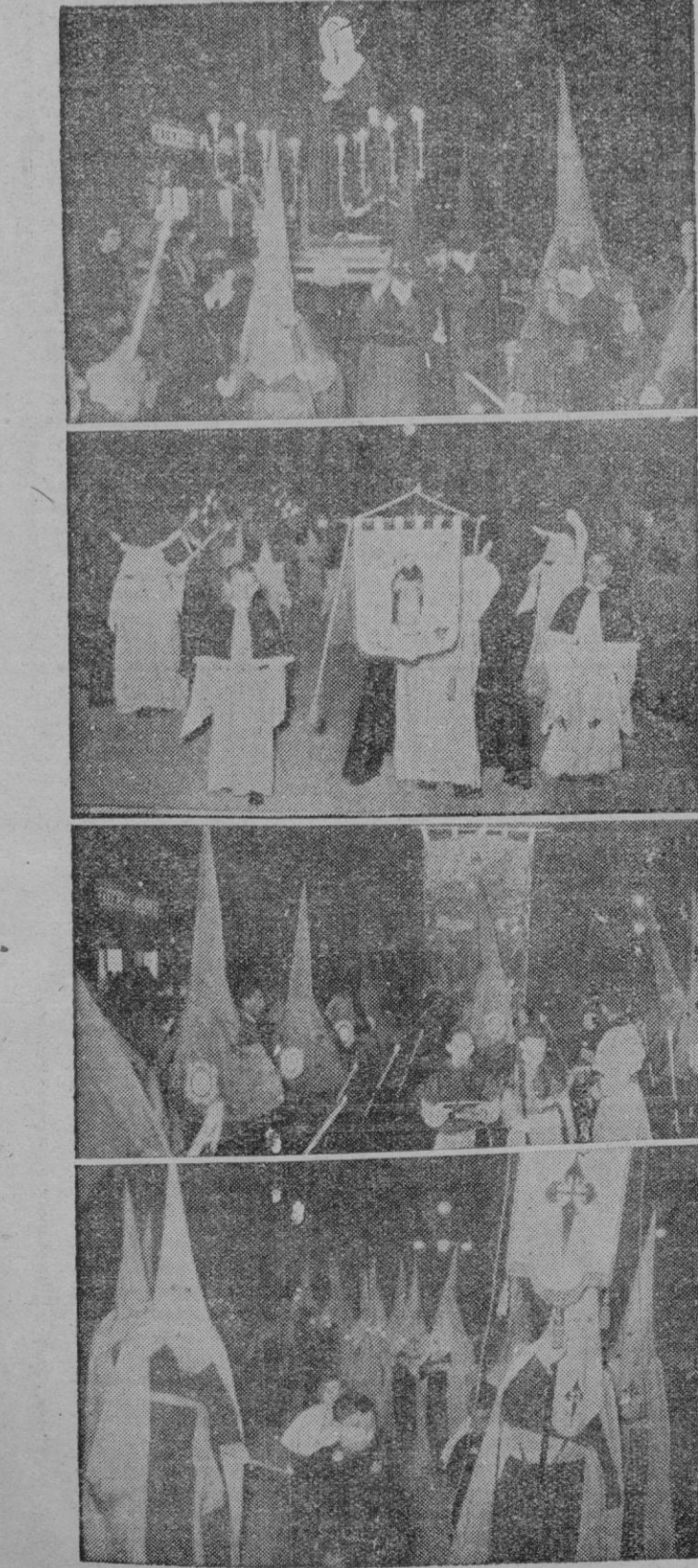
Las Cofradías asistentes a la Procesión de la Dolorosa, celebrada ayer noche.

AMAS DE CASA, NO OS PREOCUPEIS, EL LIBRO "COCINA" OS RESOLVERA TODOS LOS PROBLEMAS.