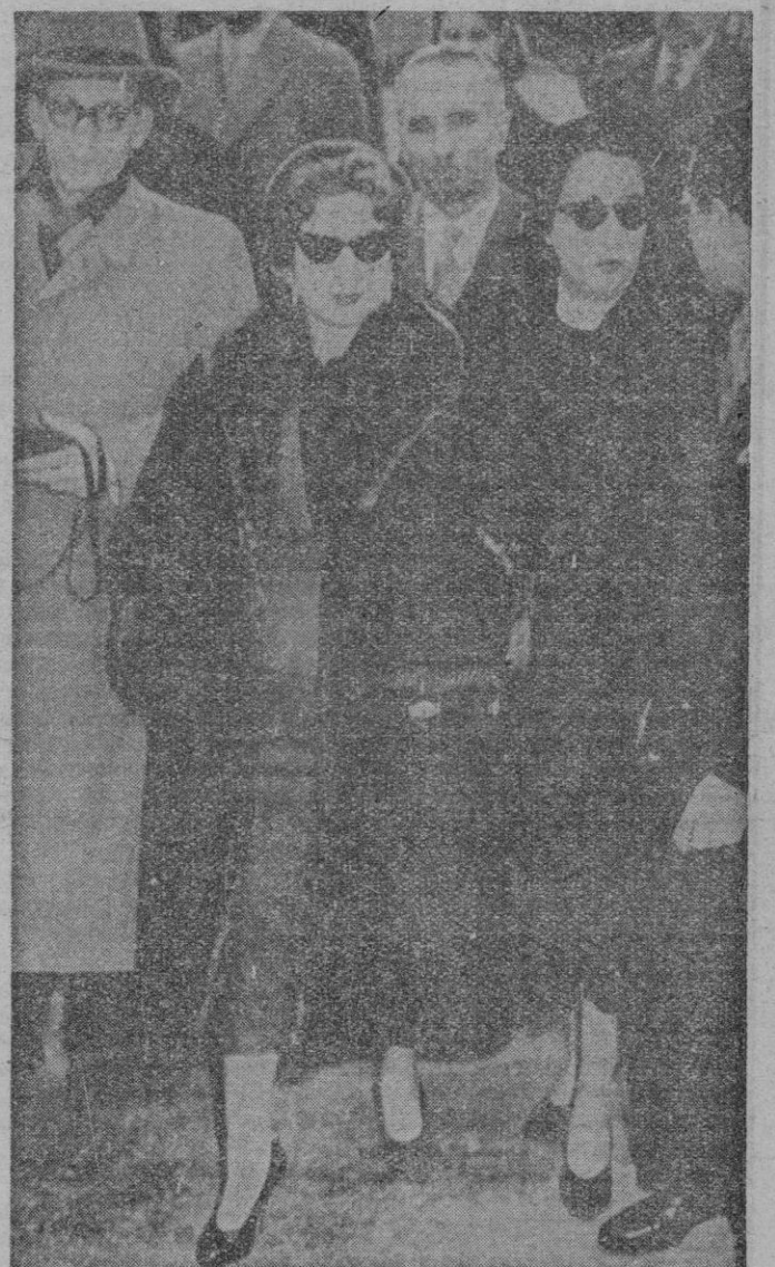
ROMA. — Estas son las primeras fotografías de la Reina Narriman llegadas después de conocerse su separación del ex Rey Faruk de Egipto y recogen un momento de su llegada al aeropuerto de Ciampino, de Roma, acompañada de su madre.