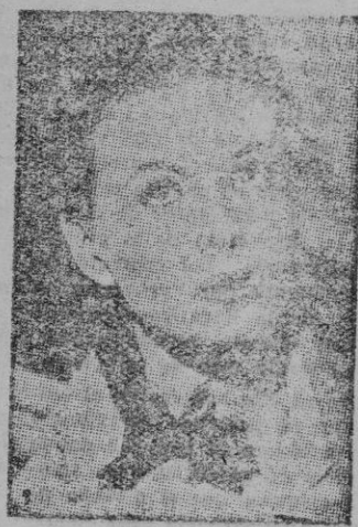
JEANNE CRAIN, la protagonista

Bien. La película es un grato pasatiempo, con unas pocas anécdotas sobre los primeros años y ensueños de un grupo de muchachos, a los que seguía el bigote allá por 1928 año en que se centra la película.