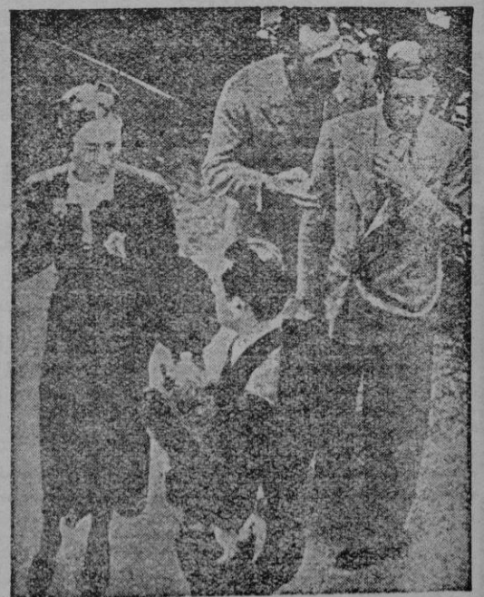
Los Duques conversando con Charles Bedaux, el famoso Industrial.

PREPARATIVOS PARA LA BODA otorgado a Mrs. Simpson, en Ipswich, el 27 de octubre de 1936, fué hecho absoluto por Sir