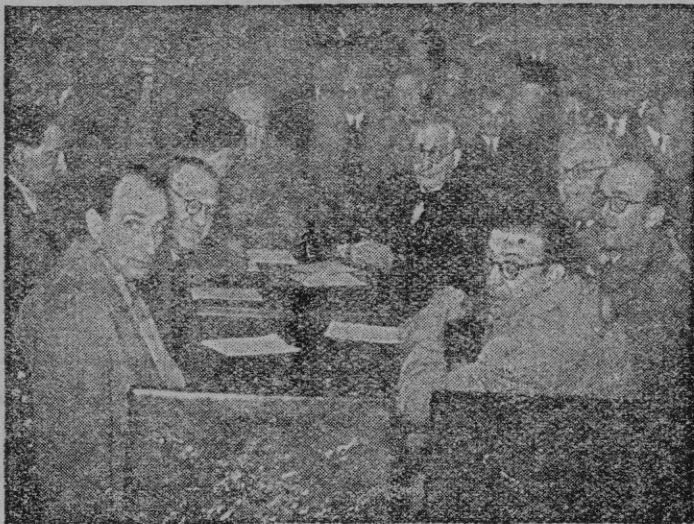
Los representantes de la Prensa palmesana.

A mí me parece maravilloso el plan de la reforma de la ciudad, aun cuando no lo he estudiado con suficiente detenimiento, pero creo que como en todos los planes ambiciosos como ese, es preciso señalarse etapas, es preciso señalarse plazos para su ejecución y es muy posible que alguno de los planes de reforma parcial, que constituyen el