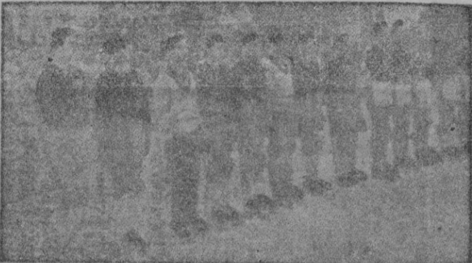
Los equipos representativos de España y Francia, forman alineados minutos antes de empezar el partido

Le preguntamos a continuación si considera al equipo francés actual como el mejor que pueden llegar a formar, y contestó diciendo que el equipo que ayer se enfrentó al español es un equipo de ocasión o de circunstancias, por