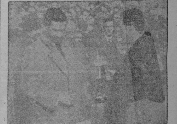
Don Juan Samaranc entregando al capitán del equipo español el trofeo puesto en litigio