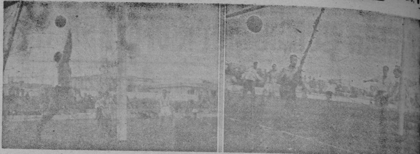
El objetivo de "Juanet" captó dos momentos del partido: En uno de ellos el momento en que Homar consigue el primer gol, al rematar al centro de Brondo. En el otro, Font desvia con apuros un fuerte chupinazo de Orozco