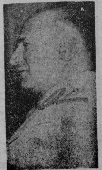
He aquí al general Nuri al-Mahdi, que preside el nuevo Gobierno iraquí, constituido por representantes de todos los partidos políticos.