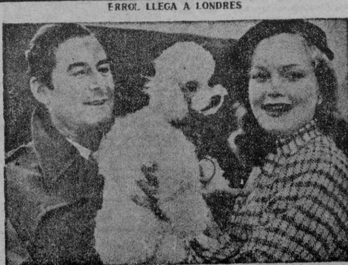
Errol Flynn y su esposa, la actriz Patrice Wymore, a su llegada a Londres, desde Jamaica, donde interpretaron una película, acarician al "poodle" blanco "Joy Boy", que Errol encargó como regalo para su bellísima esposa