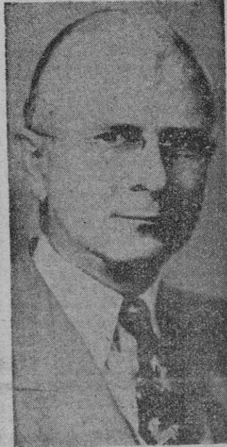
CHARLES A. SAWYER, Secretario de Comercio de los Estados Unidos

Terminó diciendo que desde España regresará directamente a los Estados Unidos dando por terminada su gira. — Cifra.