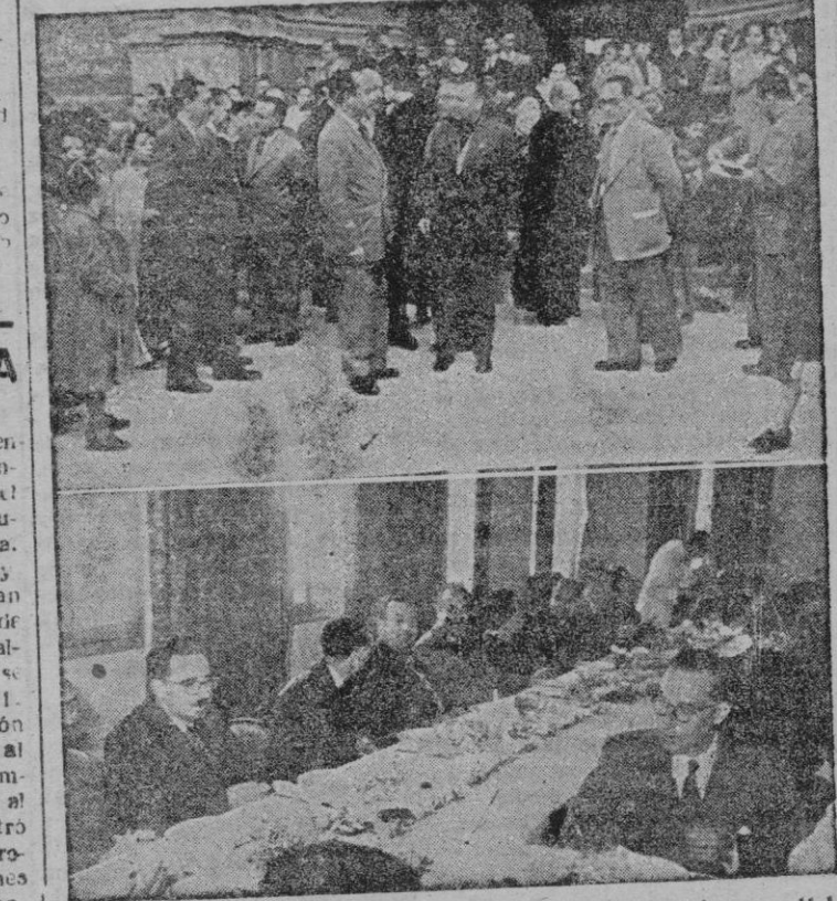
Las Autoridades a la salida de la Basílica de San Francisco — II La presidencia de la comida de hermandad en el Club Náutico