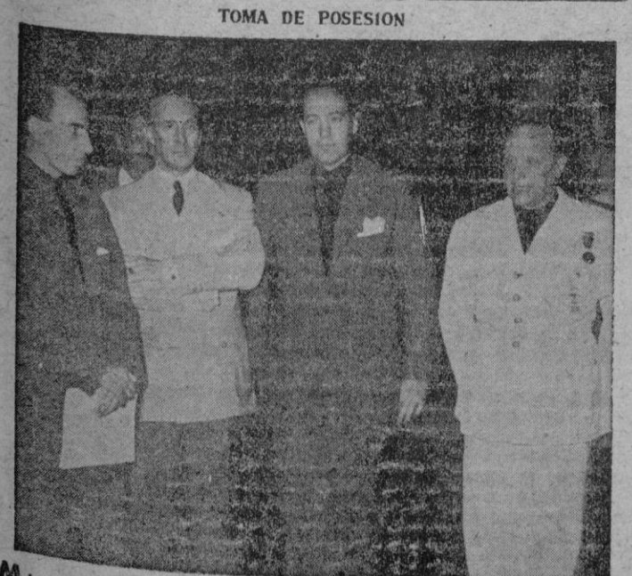
TOMA DE POSESION

Los guantes y la boina, haciendo juego con la cintura, forman parte de este original modelo, realizado en lanilla