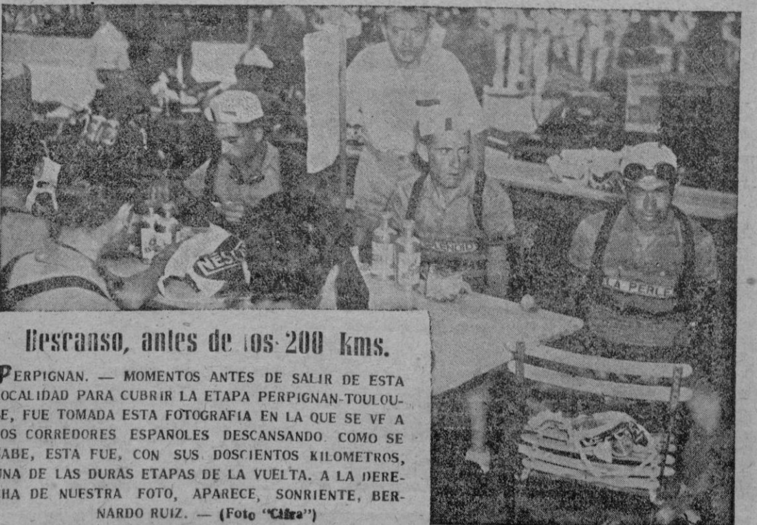
Descanso, antes de los 200 kms.

San Sebastián 16. — Un incendio se ha declarado a bordo del vapor "Poeta Arolas", anclado en el puerto de Pasajes, a consecuencia de haberse inflamado por el calor unos botes de pintura que constituían parte de la carga del barco, cuando unos obreros trabajaban cerca de los bidones de gasolina.