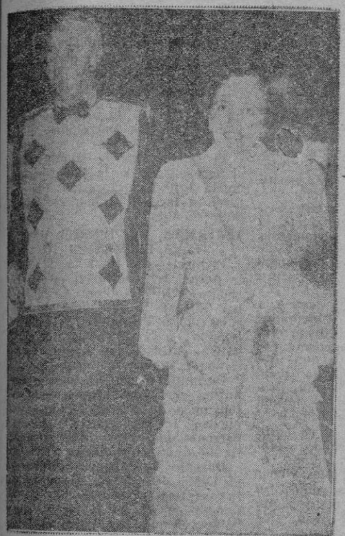
Margaret, o el porvenir de la paz.

EL MUNDO, Y MUY PARTICULARMENTE EUROPA, ya puede vivir tranquilo. Margaret Truman desea bañarse en las calientes costas europeas y su padre dice a la prensa que no habrá guerra este verano en el continente viejo.