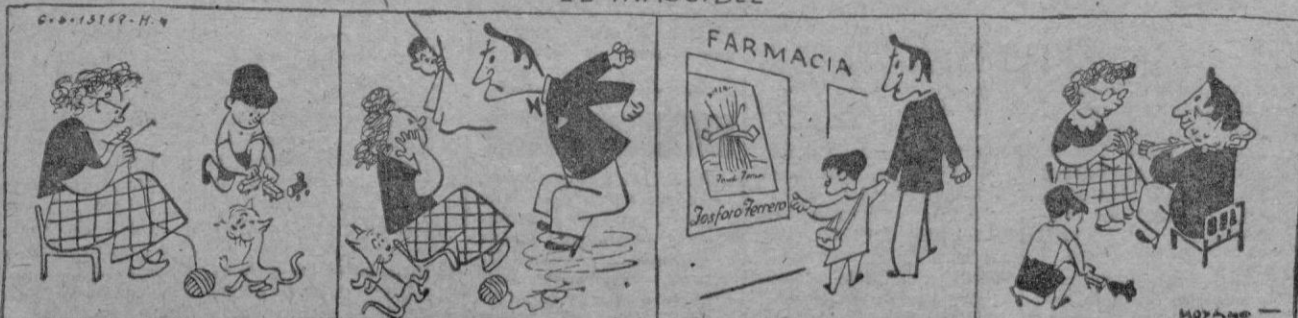
CON EL "FOSFORO FERRERO" SERA UN HOMBRE PLACENTERO