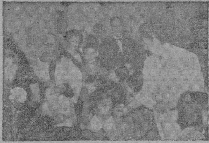
Un momento de la fiesta infantil