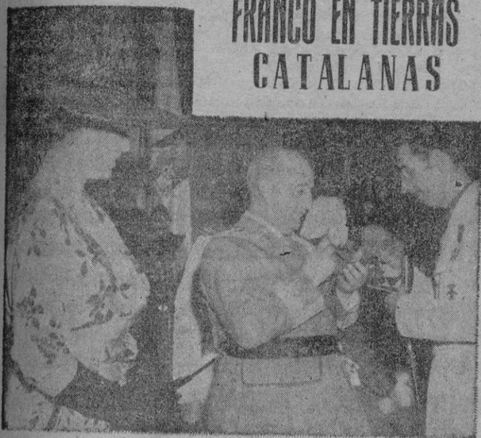
TARRAGONA. — El Alcalde de Tarragona hace entrega a S. E. el Jefe del Estado de la Medalla de Oro de la ciudad.