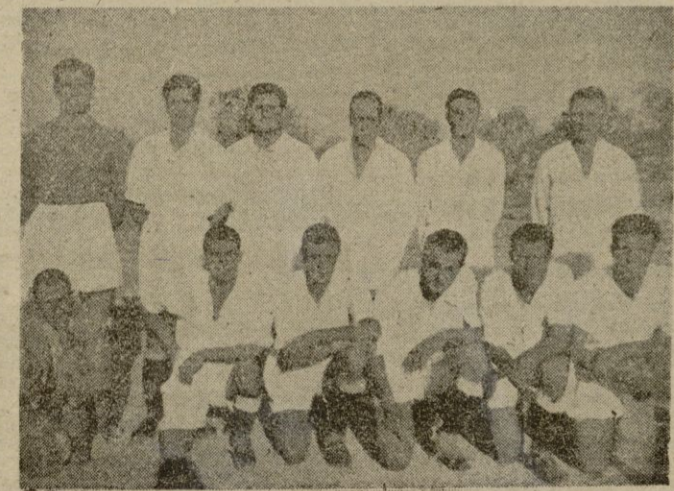
C. D. LLOSETENSE, Campeón de Baleares.

Nuestra enhorabuena a los nuevos Campeones de Baleares.