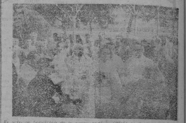
El acto de bendición de la nueva capilla. Ofició el Prelado de Mallorca.

Presidieron el acto el Prelado y Gobernador Civil