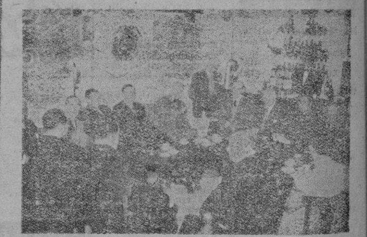
Un momento de la reunión de camaradería, en el "Hotel Victoria"