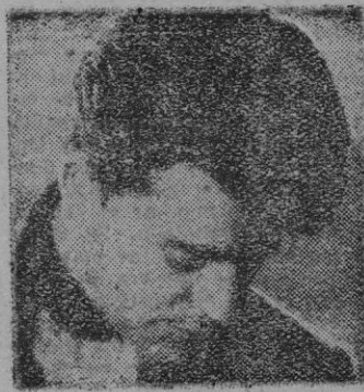
GERARD PHILIPÉ en una escena del film.

Una singular película francesa "La belleza del Diablo" en la que no llega de nuevo el poderoso estilo de René Clair, al servicio de una nueva versión del mito de Fausto.