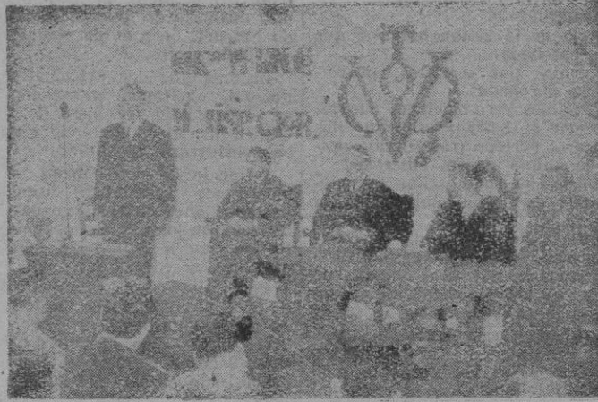
Nuestro Director en un momento de la conferencia.

Toma pie el conferenciante en estas últimas palabras para entonar un canto a la Sección Femenina falangista, diciendo que entre los dos estímulos que siempre determinan las voliciones, tanto de los individuos como de las multitudes, el egoísmo y la abnegación, el hombre fácilmente se descarría por el camino del primero, mientras que la mujer suele permane-