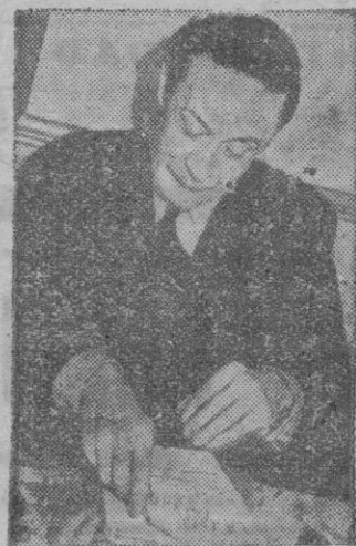
Una de las últimas fotos del conocido escritor, poco antes de caer enfermo.

Cuando el éxito le sonreía en un género literario que sólo él cultivaba en España, decidió escribir para el teatro. Estrenó en Lara "Una noche de Primavera sin sueño", que tuvo una extraordinaria acogida tanto del público como de la crítica. A esta obra siguieron otras, como "Angelines o el honor de un brigadier", "Margarita, Armando y su padre", "Los habitantes de la casa deshabitada", "Cuatro corazones con freno y marcha atrás", "Los ladrones somos gente honrada", "Las cinco advertencias de San-