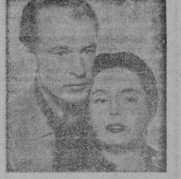
Una escena de "Dallas"

La historia nos situa en la postguerra civil entre el Norte y Sur y en la línea fronteriza de la ciudad de Dallas que, con autoridades que lo son muy poco, es todo de toda clase de forajidos yaventureros.