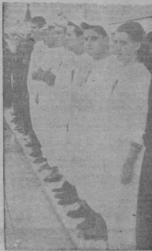
Madrid. — El equipo balear al borde de la piscina municipal, momentos antes de dar comienzo una de las pruebas del Campeonato.