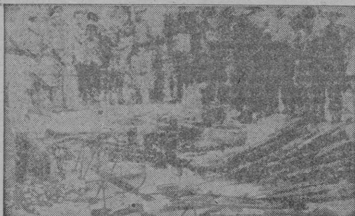
En la capital federal de Yakarta, se exhibe este material capturado a los comunistas del Norte de Sumatra

Con este paso actual y con los futuros de inclinación a Occidente, habida cuenta que en el interior del país se está combatiendo duramente al comunismo, Indonesia puede librarse de los prejuicios que emanan de su contacto con la India y el Pakistán. El orden interno del país tiene un carácter eminentemente antisoviético y la campaña de seguridad desarrollada por todo el país prosigue a ritmo acelerado.