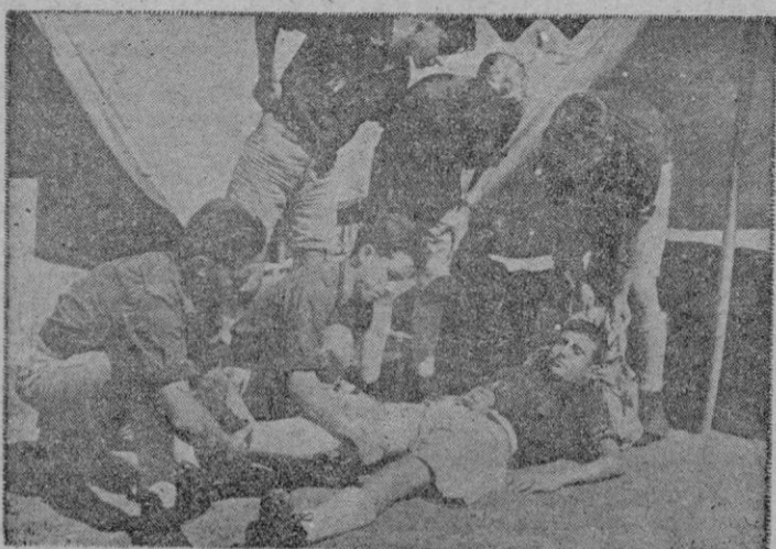
En el Campamento todo es hermandad. Los camaradas atienden a un accidentado y prestan los primeros auxilios, en tanto llega el médico

La citada Junta señala que aumenta por días el peligro de un ataque atómico contra los Estados Unidos y que es probable que un fuerte ataque enemigo pueda penetrar a través del sistema defensivo por Norteamérica. —Efe.