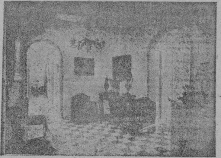
Una magnífica vista interior del "Hotel Regina" recientemente inaugurado