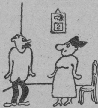
El señor no puede tardar... Siéntese donde guste.