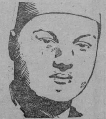
(Continúa en tercera página)

La novia lucía un vestido de satén blanco que ha sido confeccionado en París y que ha costado varios millones de francos. Lleva numerosas incrustaciones de diamantes, formando un complicado modelo que ha sido realizado por 20 modistas de una de las creadoras de la moda de la capital francesa. En su confección se han empleado cerca de noventa metros de tela. El peso del atavío que llevaba la novia se calcula entre 10 y 13 kilos.