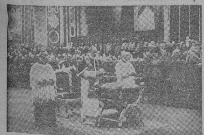
Roma. — S. S. Pío XII durante los actos de la beatificación celebrados en la Basílica de San Pedro. A tan solemne ceremonia asistió el ministro de Obras Públicas, señor Fernández Ladreda, acompañado de sus familiares.

BEATIFICACION DE LOS DOMINICOS ESPAÑOLES, MARTIRES EN TONKIN