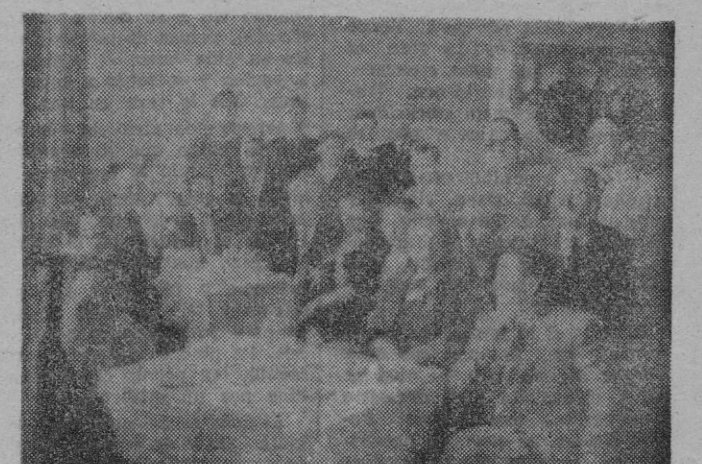
Dos "fotos" de los actos celebrados ayer. La inferior, fué obtenida en "Riskal", donde nuestros productores fueron atentamente obsequiados

El Sindicato Provincial del Papel, Prensa y Artes Gráficas honró el domingo, día de su festividad, a su Santo Patrón, San Juan ante Portam Latinam, con solemne misa que se celebró en el altar mayor de la iglesia de Ntra. Sra. de Montesión, de los Rdos. PP. Jesuitas.