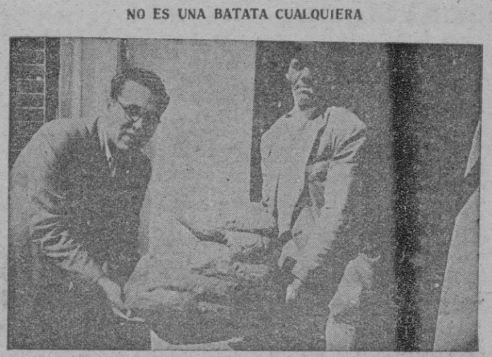
Isla de Lanzarote. — Estos dos señores emplean sus fuerzas en levantar una enorme batata de 31 kilos, recogida en una finca de esta isla.

LA REUNION DE ESTA TARDE DURO CUATRO HORAS. NO SE PRESENTARON NUEVAS PROPOSICIONES Y EN EL CURSO DE LA MISMA SE TENDIO A PROCURAR DIRIMIR LAS DIFERENCIAS EXISTENTES ENTRE EL BORRADOR DEL TEMARIO SOVIETICO Y LA AGENDA OCCIDENTAL, DIFERENCIAS QUE SE CENTRAN EN DOS PUNTOS: 1) SI LA DISCUSION SOBRE ARMAMENTO DEBE LIMITARSE A LAS DE LAS CUATRO GRANDES POTENCIAS, Y 2) SI EL NIVEL DE ARMAMENTOS DEBE SER DISCUTIDO ANTES QUE LA REDUCCION DE LOS MISMOS. — Efe.