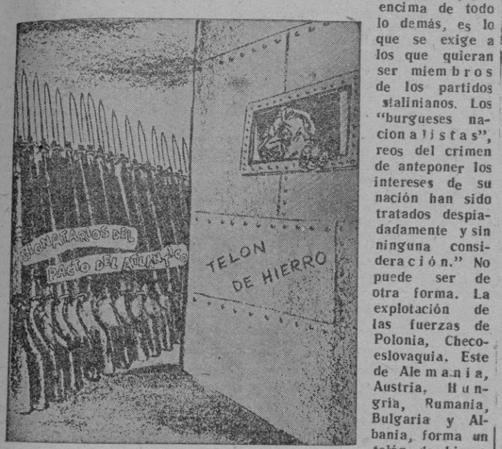
No todo deben ser frios antagonismos

Dice el "Times", en una cita a los checos, y a través de informes fechados en Nueva York, que en la "lealtad a la Unión Soviética, por encima de todo lo demás, es lo que se exige a los que quieren ser miembros de los partidos stalinianos. Los "burgueses nacionalistas", reos del crimen de anteponer los intereses de su nación han sido tratados despiadadamente y sin ninguna consideración." No puede ser de otra forma. La explotación de las fuerzas de Polonia, Checoslovaquia, Este de Alemania, Austria, Hungría, Rumania, Bulgaria y Albania, forma un telón de hierro considerado desde el punto de vista de Occidente. Y pensamos siempre más en una brusca reacción de los países oprimidos que en atender a la afirmación histórica de los eternos valores humanos. Hacia estos debería dirigirse con más atención el esfuerzo occidental. El telón de acero debe ser considerado como una delimitación de sangre y calamidad que precisa enjugarse. No es tan sólo que los signatarios del Pacto del Atlántico enfrenten sus bayonetas al blindaje de hierro moscovita. Demasiada frialdad — repetición de un esquema de tiranía — la del gráfico del "The Chicago Sun-Times", con que ilustramos nuestro comentario.