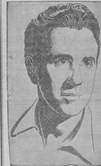
JUAN DE ORDUNA Sigue sin convencernos

Palma de Mallorca, día 19 de Octubre de 1950. -- El Alcalde,