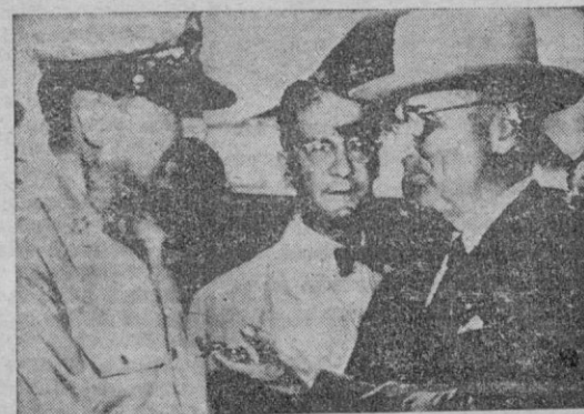
Al finalizar la histórica entrevista en Wake, Truman entrega al general la Medalla con que se le ha recompensado

Hong-Kong 20.—De fuente competente se afirma que el jefe comunista de Corea del Norte, Kim-Li-Sung, se propone establecer un gobierno exilado en Manchuria, territorio a donde se ha ordenado que se retiren las fuerzas rojas.—(Efe.)