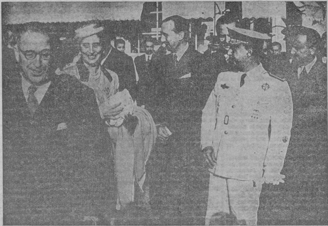
S. E. el Jefe del Estado, Generalísimo Franco, acompañado de su esposa y de varios ministros del Gobierno español, a su llegada al aeropuerto de Barajas, desde donde emprendió el viaje en avión a los Territorios del África Occidental Española.

Después se ha seguido viaje a El Aaiun, capital del Sahara Español, donde el Caudillo recibirá a las tribus nómadas y pasará la noche, mientras llega la hora de emprender el vuelo a Canarias, y con él, la etapa crítica de esta visita a los Territorios Españoles del África Occidental, de gran alcance político — que tantas repercusiones inmediatas va a tener en un porvenir inmediato. El propio Generalísimo lo hizo observar así en Sidi Ifni, aludiendo a la circunstancia