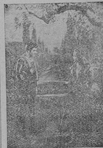
Wanda Hendrix-Tyrone Power

EL contraste en este caso consiste: Los unos, los norteamericanos, gozan de la máxima fama, son aclamados — o criticados — en el mundo entero y sus fortunas, suponemos, a pesar de los tan comentados impuestos americanos, deben ser como para desearlas cualquiera.