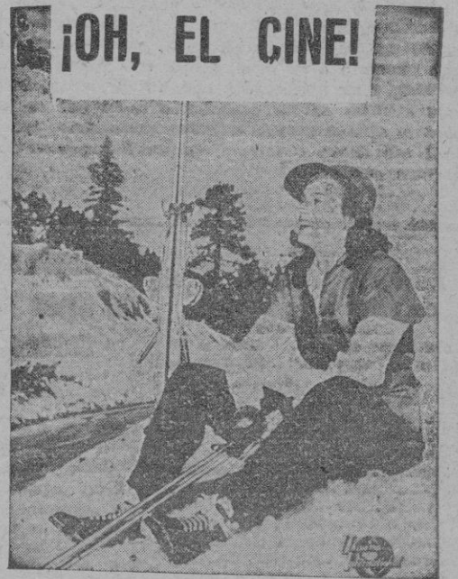
Marta Toren, sueca ella y bonita ella, con permiso de quien sea, finge una sonrisa feliz en un fingido paisaje de nevadas cumbres... La vida del cine, amigos, la vida del cine. A cine está dedicada íntegramente nuestra sexta página. Léala, por favor; viene buena

El cuartel general anuncia, que se han hecho prisioneros, equivalentes a cuatro divisiones completas de los coreanos del Norte.—Efe.