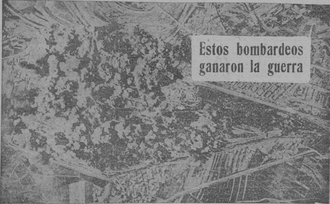
Estos bombardeos ganaron la guerra

Entre otras cosas, don Esteban Bilbao dijo: “Ya lo ha dicho vuestro ilustre Presidente del Consejo...” (Continúa en cuarta pág.)