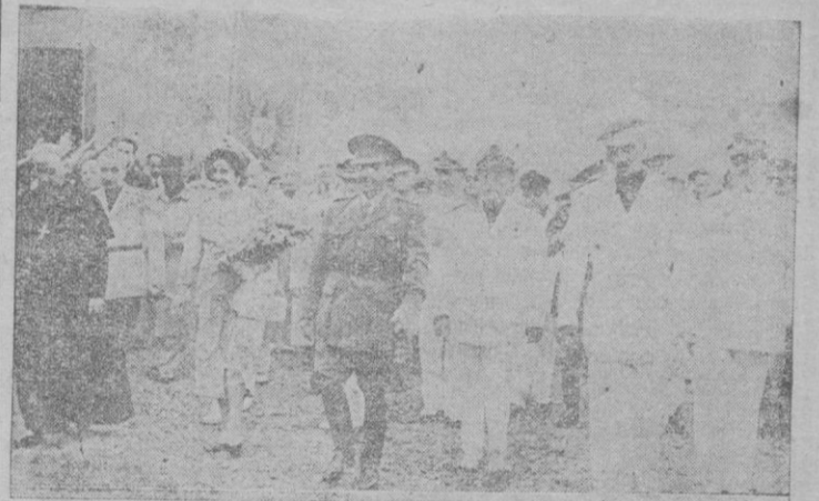
San Sebastián. — Acompañado de su esposa, del ministro de Justicia y diversas personalidades, S. E. el Jefe del Estado llega al lugar denominado Caño de Anzota para inaugurar un estadio construido por el Frente de Juventudes.