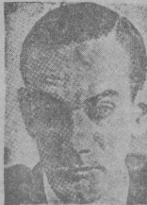
CAMILO JOSE CELA