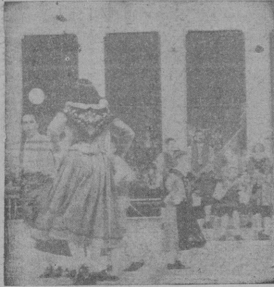
El grupo de danzas mixtas de Suiza, durante su brillante actuación.

Quien traza estas líneas, acompañando a las agrupaciones españolas, presenció el Certamen de Llan-