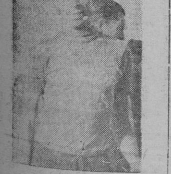
OLIVER popular "Salón" no podía faltar en esta gran prueba.

Hay podemos adelantar a nuestros lectores la primera lista de inscritos, en la cual como podrá comprobar figuran los más destacados ases de las categorías inferiores.