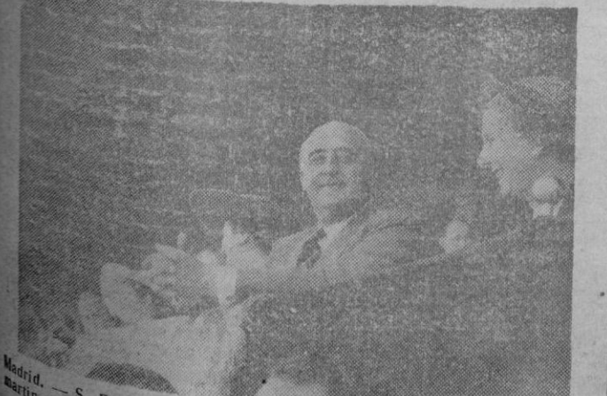
Madrid.— S. E. el Jefe del Estado en la tribuna del Estadio de Chacarín, presenciando el partido final del Campeonato de España de Fútbol, Copa de S. E. el Generalísimo.