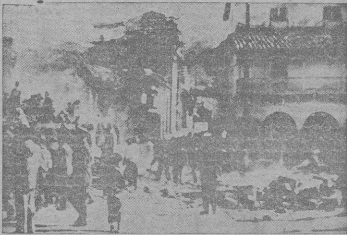
Cuzco (Perú). — Soldados paisanos rebuscan entre las ruinas de los edificios destruidos a consecuencia del terremoto del pasado día 21, para extraer las víctimas aprisionadas entre los escombros