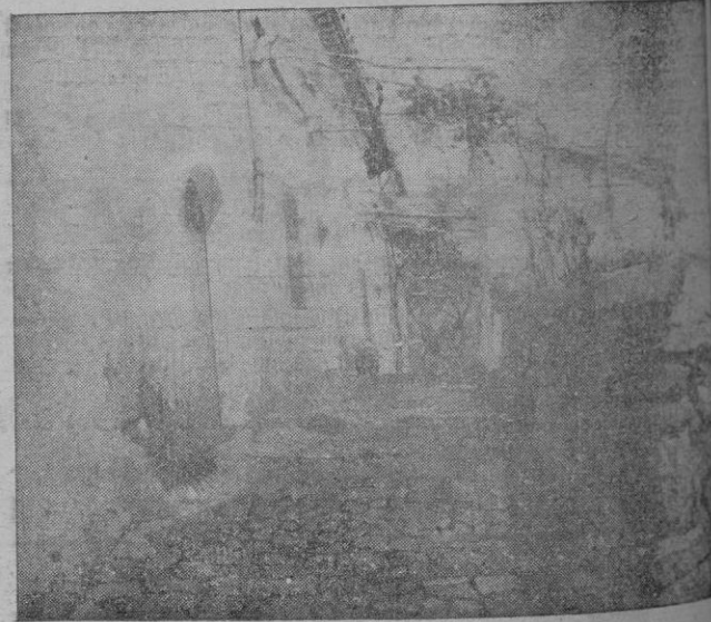
"Casas", paisaje de Ramón Nadal que ha obtenido el 3.º Premio del Certamen de Primavera de Galerías de Arte Quint.

primera parte del programa fuese repetida en un local cerrado, aunque tuviera que aprovecharse para ello una fecha de los conciertos de abono.