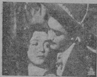
Una escena del film.

(Lirico, Palear, Progreso) Jorge Negrete en parodia de Jorge Negrete, esto es "No basta"