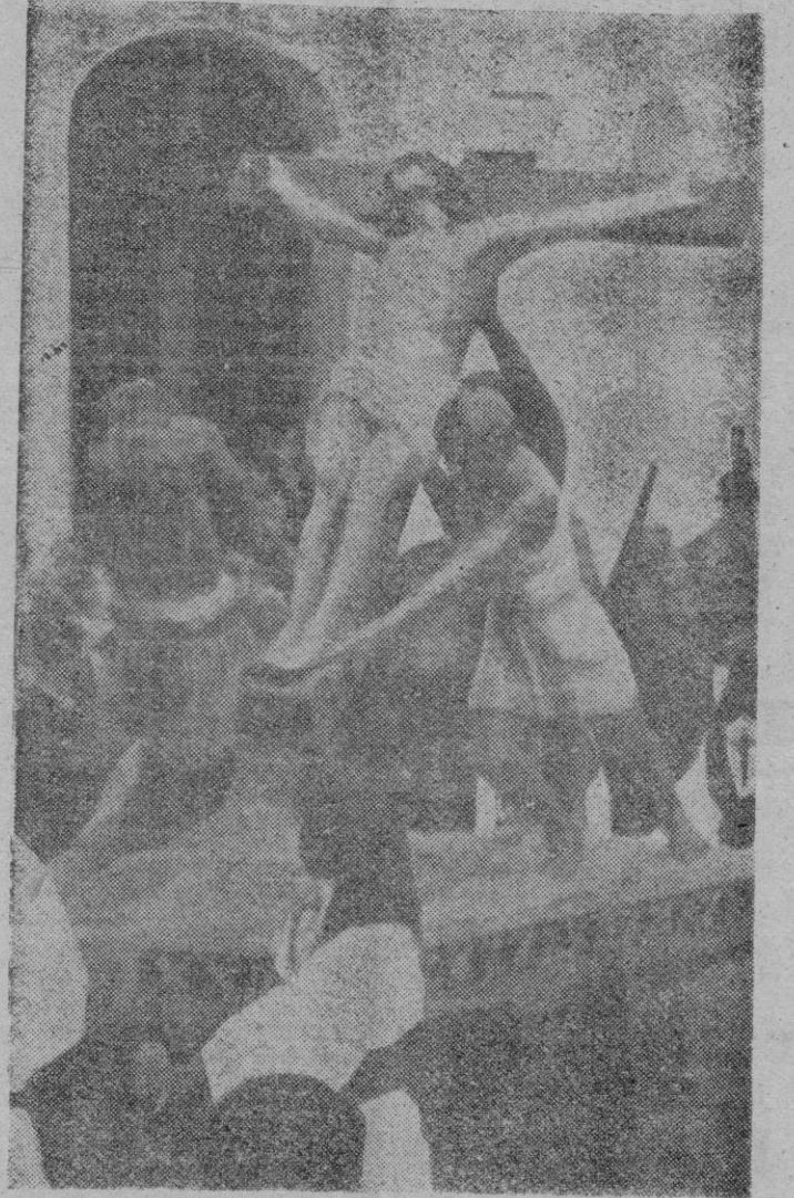
Uno de los más bellos "pasos" de la Semana Santa española. La imagen de Cristo, sobre la Cruz redentora, pasa levantando entre los muchedumbres un rumor de oraciones fervientes

orme muchedumbre que temía quedarse sin dar un beso a la sagrada reliquia.