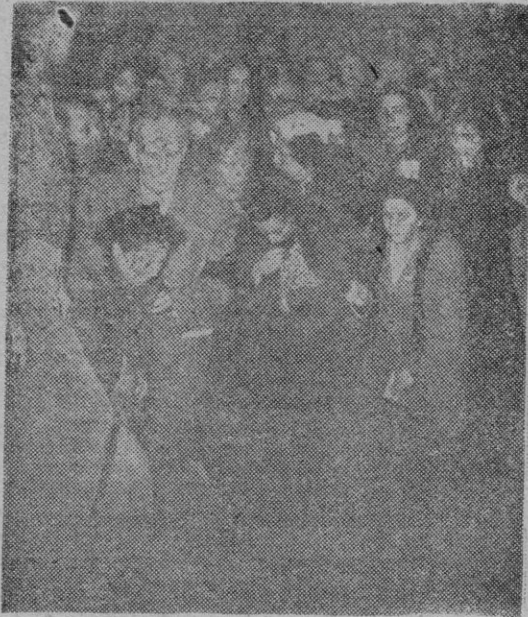
Madrid. — La «Cruz de Jerusalén» que llegó a esta capital procedente de Roma, quedó expuesta a los fieles en la Iglesia de Santa Cruz, donde una gran multitud acudió a recibir la preciada reliquia

mo allí en otras ciudades del universo, se ha producido en torno a la Cruz de Jerusalén la mayor manifestación religiosa que se haya registrado en la Historia de la capital azteca. Más de un millón de mejicanos — ¡cuántos españoles! — desfilaron a mediados de enero por la Basílica de Ntra. Sra. de Guadalupe a besar la reliquia de la Cruz de Cristo. El entusiasmo fué de tales proporciones que un día resultaron heridas sesenta personas a causa de las gualdras de la