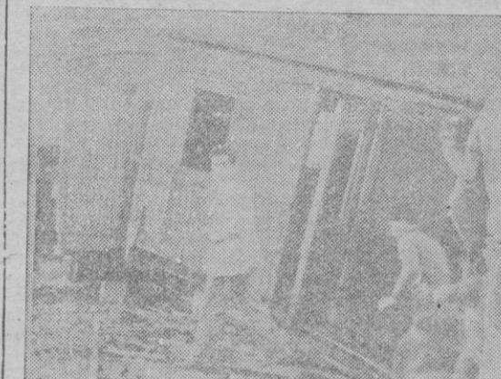
Cuatro instantáneas del descarrilamiento ocurrido el martes, en la línea férrea Palma-Santanyí. Como se vé, fué total la destrucción de los cinco coches — dos de pasajeros y tres de mercancías — que saltaron de la vía, aunque, a Dios gracias, sin ocasionar más que un pequeño número de heridos