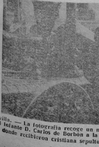
Sevilla. — La fotografía recoge un momento del traslado de los restos del Infante D. Carlos de Borbón a la antigua Colegiata de El Salvador, donde recibieron cristiana sepultura.