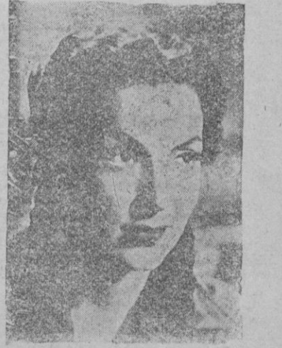
Barajas 16. — Procedente de París ha llegado la artista cinematográfica Maria Felix. En el aeropuerto fué recibida por varios directores y artistas de cine, reporteros y fotógrafos.