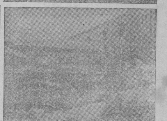
Cuatro instantáneas del descarrilamiento ocurrido el martes, en la línea férrea Palma-Santanyí. Como se vé, fué total la destrucción de los cinco coches — dos de pasajeros y tres de mercancías — que saltaron de la vía, aunque, a Dios gracias, sin ocasionar más que un pequeño número de heridos