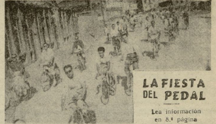
LA FIESTA DEL PEDAL

so en el resultado, ya que permitió se consiguieran, no uno, sino varios de los goles en descarado fuera de juego. Pero el espíritu que anima hoy a las huestes del (Continúa en la página siguiente)