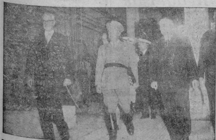
Puentes de García Rodríguez. — S. E. el Jefe del Estado con los Ministros de su Gobierno y otras personalidades visita las instalaciones de la nueva central térmica, por él inaugurada.