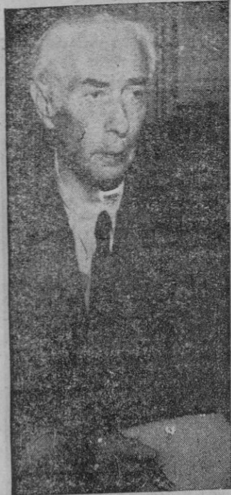
THEODOR HEUSS, que ha sido elegido Presidente de la República Federal Alemana del Oeste por el Parlamento de Bonn.