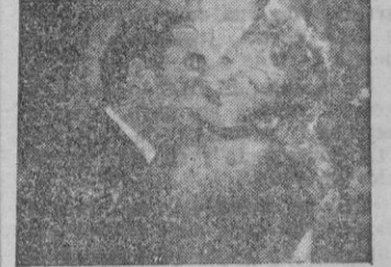
Una escena del film

Ambos detalles —que llevados al extremo pueden producir catástrofes—, no exagerados en Soffici, mezclados con talento