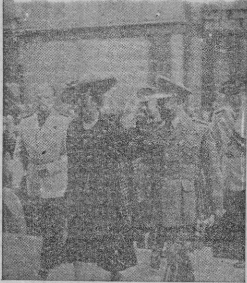
San Sebastián. — S. E. el Jefe del Estado a su llegada al templo de Santa María, es saludado por los Ministros de Asuntos Exteriores y Justicia.